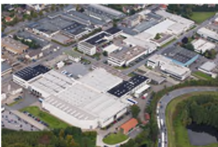
Böllhoff Zentrale Bielefeld

Zum Selbstverständnis der Böllhoff Gruppe gehört seit mehr als 135 Jahren die Flexibilität und Schnelligkeit eines unabhängigen Familienunternehmens. Diesen Anspruch hat das Unternehmen natürlich auch an seine Partner und Lieferanten.